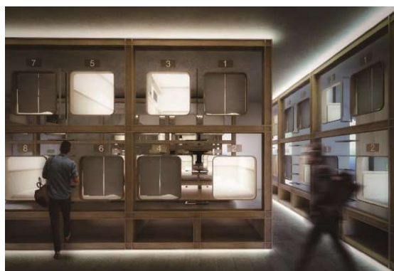
カプセルホテル（イメージ）