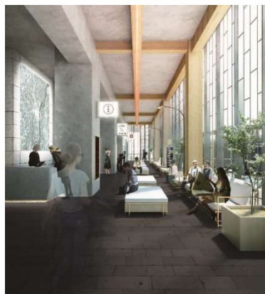
バスステーション（イメージ）

貸切バスの発着 1 発着 1,200 円 （チェックインカウンターを利用する場合はカウンター利用料別途）